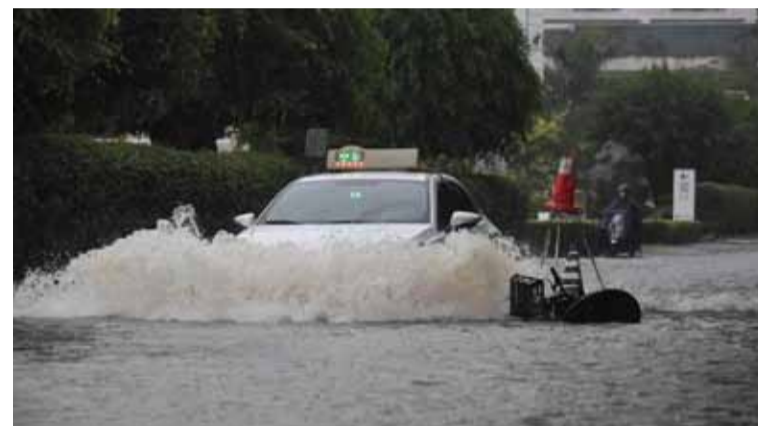
En Hainan. El tifón Trami provocó siete muertes

El tifón Trami causó siete muertos y un desaparecido en la provincia insular de Hainan, en el sur de China, informaron hoy miércoles las autoridades de gestión de emergencias de la isla.