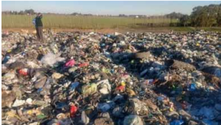
En San Nicolás. El basural donde la beba fue encontrada sin vida

La mujer, presunta homicida, llega al juicio cumpliendo