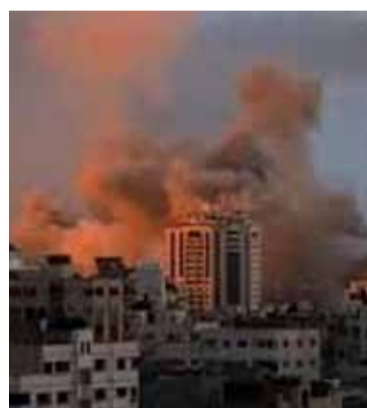
Otra incursión. El ataque israelí provocó la muerte de 26 palestinos

Las Fuerzas de Defensa de Israel (FDI) dijeron en un comunicado este miércoles que su Fuerza Aérea mató a Mustafa Ahmad Shahadi, subcoman-