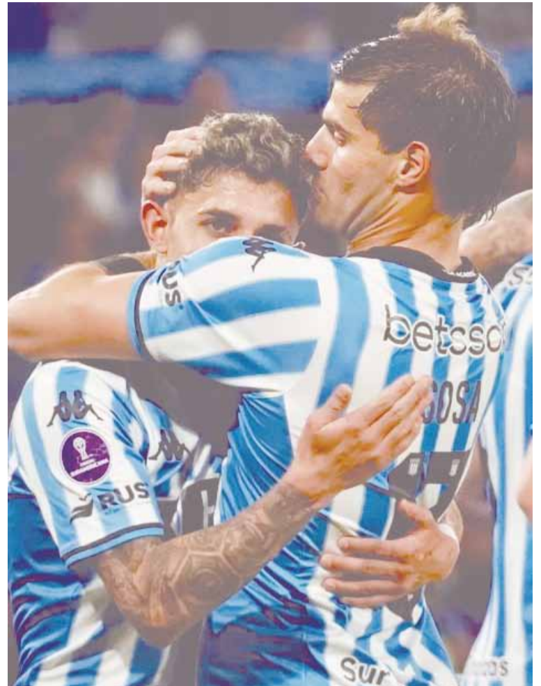
Racing quiere llegar a la final

Racing recibirá este jueves al Corinthians de Brasil con la premisa de obtener un triunfo que le permita sortear las semifinales de la Copa Sudamericana y así avanzar al encuentro definitorio tras igualar 2-2 en la ida.