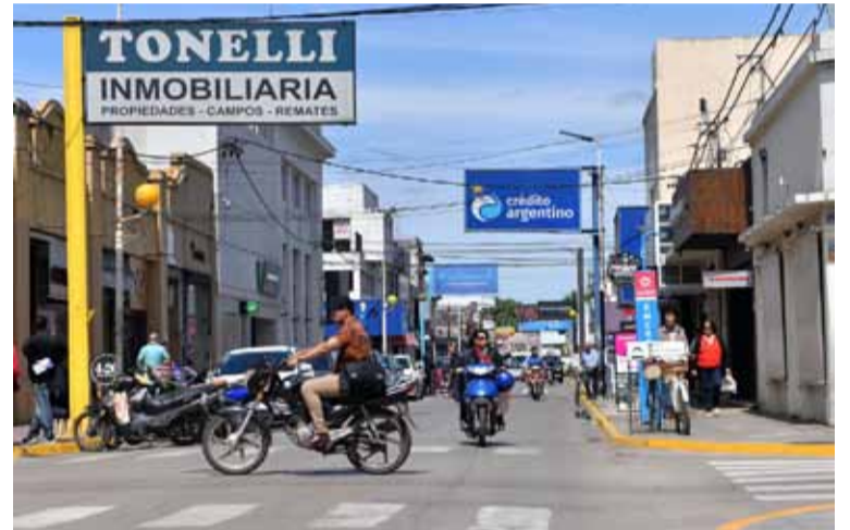
En San Pedro. Los damnificados siguen sin recibir el dinero depositado

La empresa pedía 88 dólares para devolver fondos, pero no lo hizo