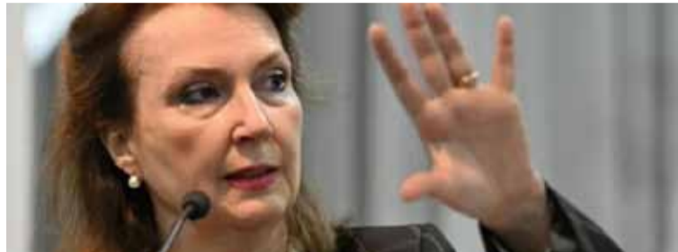
La economista Diana Mondino dejó de ser la Canciller de Argentina

Fuentes diplomáticas habían explicado que era un ejercicio de pragmatismo de cara al objetivo diplomático de la recuperación de las islas Malvinas. "Hubiese sido muy