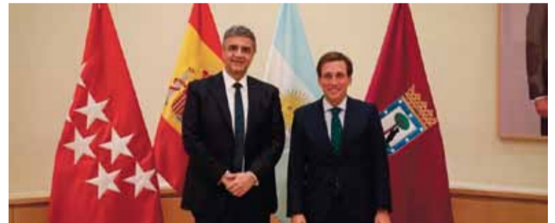
Jorge Macri, junto a Alberto Núñez Feijóo

En Madrid, Macri mantuvo un encuentro con empresarios españoles de sectores estratégicos, como Construcciones y Auxiliar de Ferrocarriles (CAF), Abertis, Santander, Iberia y Telefónica, entre otras firmas. También dialogó con empresarios argentinos radicados en el país ibérico, destacando el rol clave del sector privado en el desarrollo económico.