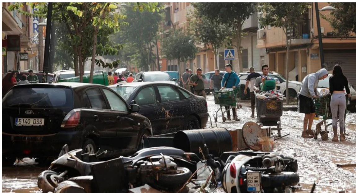
Destrucción. En las calles de Valencia tras las inundaciones

Entre los fallecidos hay varios menores de edad y la cifra podría superar los 100