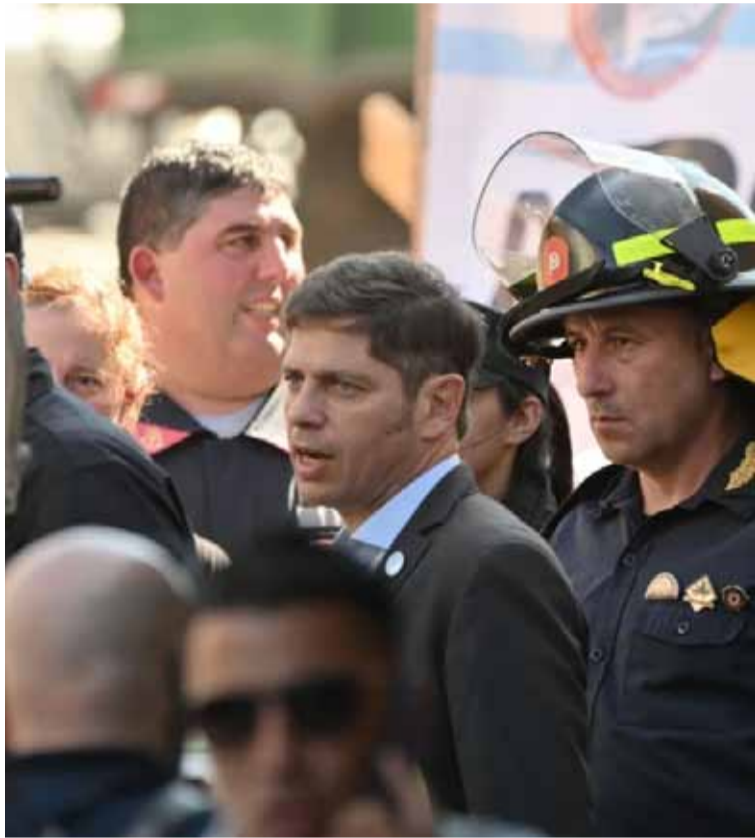
El gobernador estuvo en el lugar del hecho