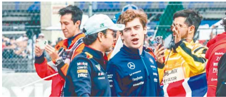
Colapinto podría reemplazar a "Checo" Pérez

A pesar de esta declaración, la postura de Marko deja abierta la